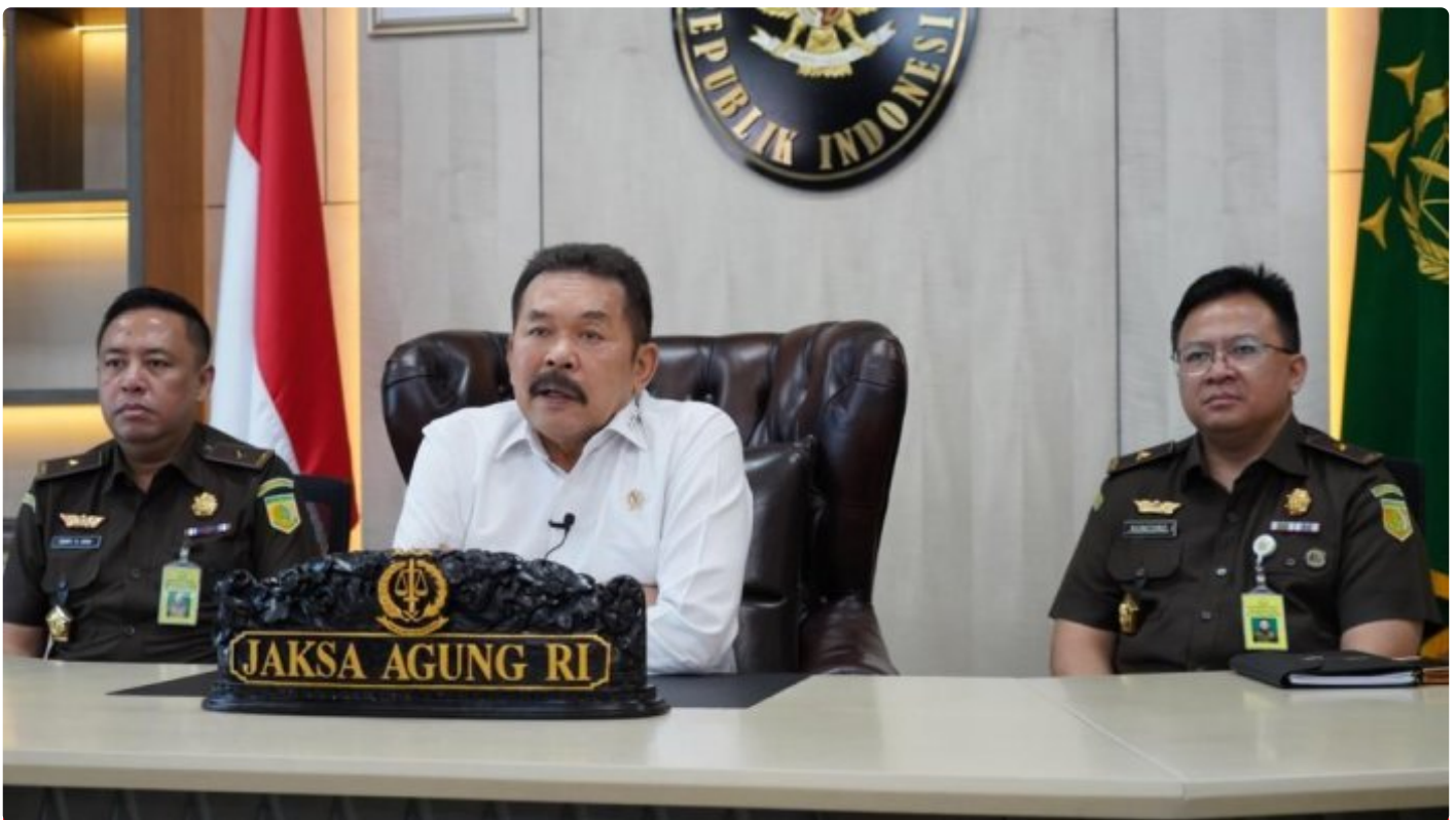
Jaksa Agung, Burhanuddin